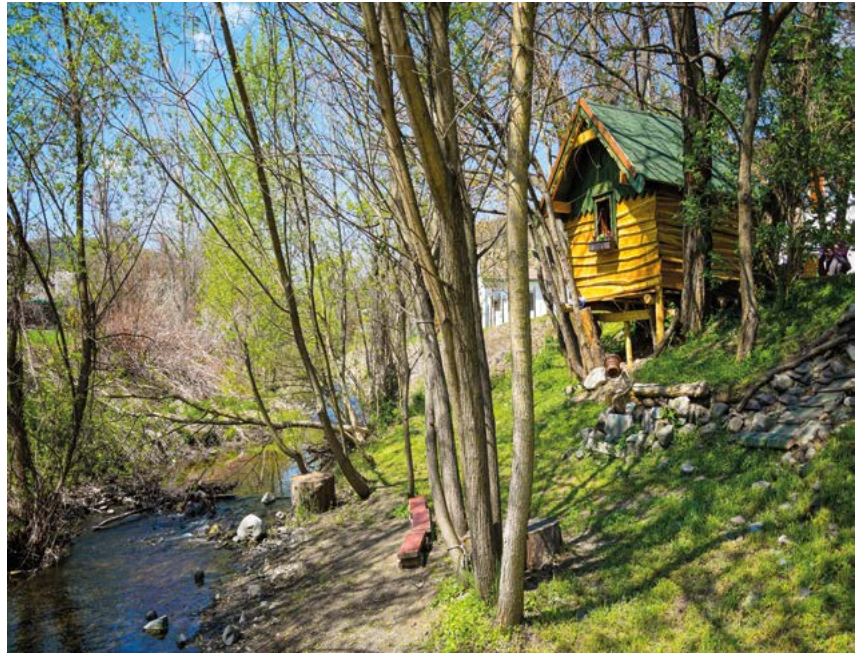
Zöld Megoldás-pályázat Kismaros