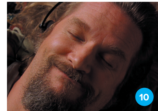
Jeff Bridges (Nagy Lebowskí)

Ha nem tudunk fizikailag elutazni, utazzunk el lelkileg és szellemileg: olvassunk könyveket! Inspiráció extra: adjunk ki mi könyvet, egyedül vagy barátokkal kalákában! Az elmúlt évek egyik leginspirálóbb élménye volt, amikor kiadtuk Eszter barátunknak a Fűszer és Lélek gasztroblogkönyvet.